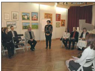
Nagovor varuhinje človekovih pravic