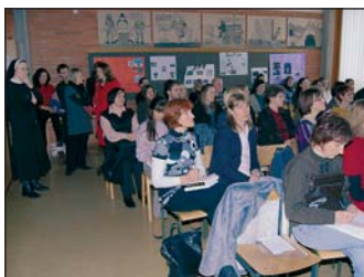
Prispevki po sekcijah