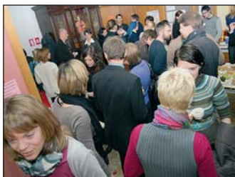
Druženje med odmori